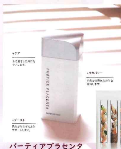
パーティアプラセンタ