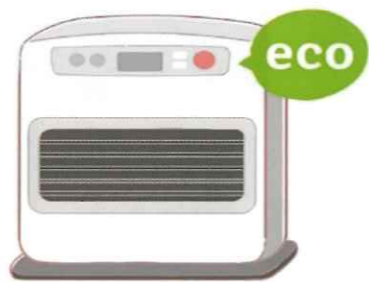
暖房器具は、暖めすぎを防ぐエコ運転などを利用するのも良いですね！

●ガスを使った暖房器具を使うとき ガスの床暖房は、スイッチを切った後も、しばらくは暖かさが残るので、寝る前やお出かけ前は少し早めに切るとガスの節約になります。