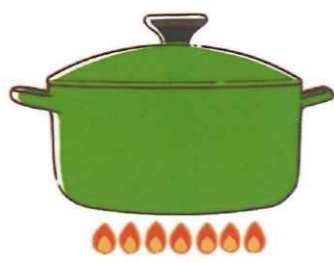
お湯を沸かすときはフタをすることで、熱が逃げるのを防ぎ、早く沸くので省エネにつながります。