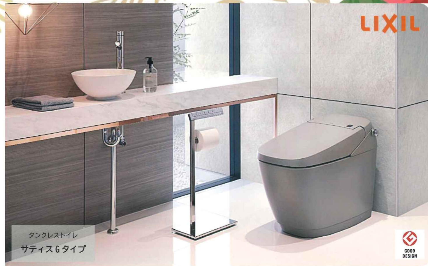
タンクレストイレ サティスGタイプ